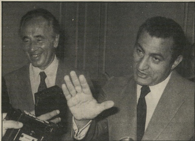
מובארכ עם פרס אילו הסכים ערפאת

ה אמת ההיסטורית היא שהסכם-המיסגרת של קמפדייוויד לפיתרון הבעייה הפלסטינית (להבדיל מן ההסכם על שלום ישראלי-מצרי) היה תלוי מלכתחילה על בלימה. היא היה מושתת על רמאות. רמאות הדדית מודעת.