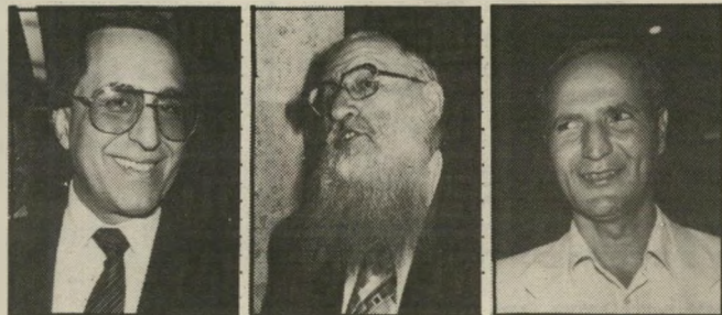
שחל פרש אררי העלית את סחיר הרתיים לאין שיעור?

למרבית הפלא, רק ארבעה מהמשתתפים סלרו מההתחייבות. היו אלה יצחק נבון, גר יעקובי, יעקב צור ומד כ"ל המיפלגה, עוזי ברעם. השאר הצביעו בהתלהבות כער. עוז וייצמן ומר טה גור הפתיעו באומרים: "זה בכלל לא חשוב! אנחנו לא מוותרים על מייודע מה..." לעומתם, נזעקו צור ויעקובי והתריעו בחומרה: "זהו מישגה לאומי!"