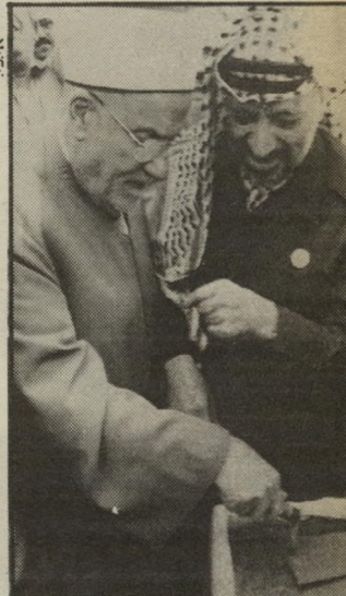
ערפאת באלג'יר כסו ארלוורוב

אלם כל המחסמים והעיוכים ה- אלה אינם אלא זמניים. הסרות העצמאות, אף שאינה אלא צידוף של מלים, שינתה את המציאות מן היסוד. במציאות הפוליטית יש ה- שיבות מסרעת לנתונים פסי- כולגיים. ההכרזה הזאת היא נתון פסיכולוגי הנובע מן ה- עובדות המשמיע על העובי- דות. האינתיפאדה תימשך. היא תקבל