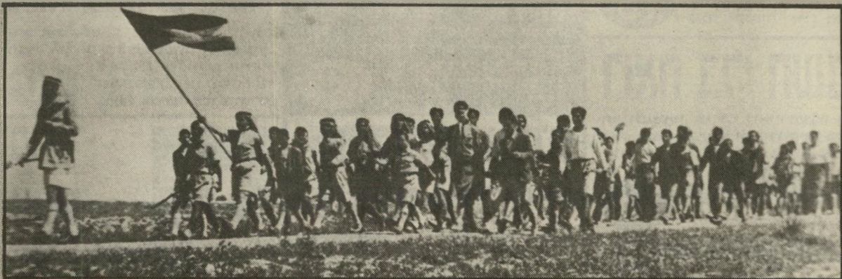
דגל פלסטיני ב"1946 (של תנועתהתנועה אלתיגאדה, שהתנגדה למופת) דגל אש"ף, דור שלם לפי לידת אש"ף

כאותו הזמן נולד גם השימוש במושג "רגל אש"ף", כשהכונה רגל הלאומי הפלסטיני אשר נולד ב"1917 או ב"1918, כמעט 50 שנה לפני לידת אש"ף. אם זהו רגל אש"ף, כלומר רגל המדינה האש"ף.