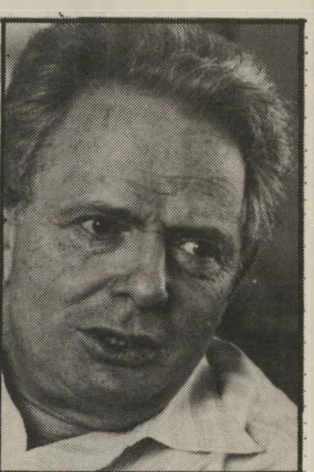
מנכ"ל-לשעבר לפיד, לחץ פוליטי הוא דמוקרטי

הוא סיפר עוד כי לאורך תקופה ארוכה הלך לקראת גרוסמן בעניינים שונים. לרביו, הגיש גרוסמן בזמנו בקשה לכתוב את הזמן הצהוב. לפי הזמנת השבועון כוחרת-דאשית. הזמן הצהוב הוא במקור כתבה בשבועון, שתיארה את המצב בשטחים הכבושים במחנות החיים היומיומיים של התר-שבים שם, ושנכתבה לקראת מלאת 20 שנה לכיבוש. פורת התנגד לכך ש גרוסמן בכתבתו יהפוך לחלק ממערכת המתנגדת לכיבוש, אך היה מוכן שיי-כתב צילום-מצב, בתנאי שבאותו הגי-ליון של השבועון לא יופיעו מאמרים פובליציסטיים נגד הכיבוש, שיתנו לכ-תבתו של גרוסמן פירוש פוליטי. ואכן, אותו הגיליון הוקדש כולו לזמן הצהוב, ולא נכללו בו מאמרים נוספים.