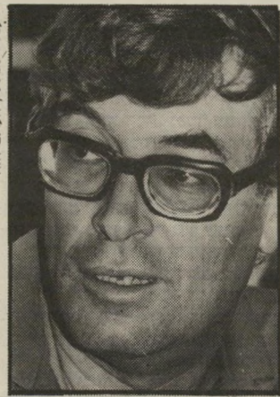
מנכ"ל-לשעבר ליבני סירוב לדין

החלטה נוספת של הרשות, שבוטלה בבג"ץ, היתה ההחלטה שלא לראיין או