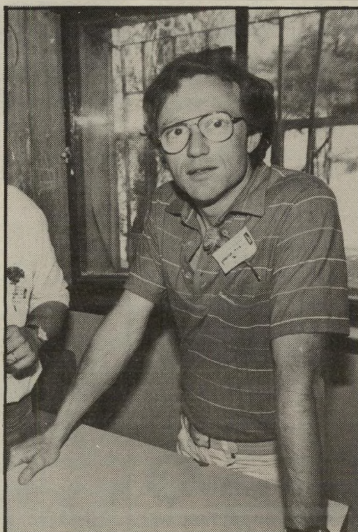
מתפטר-מופטר גרוסמן לא, נדה, לא, נדה מערבית

ישראל, אשר נמצאים בשליטת מדינת-ישראל מאז יוני 1967.