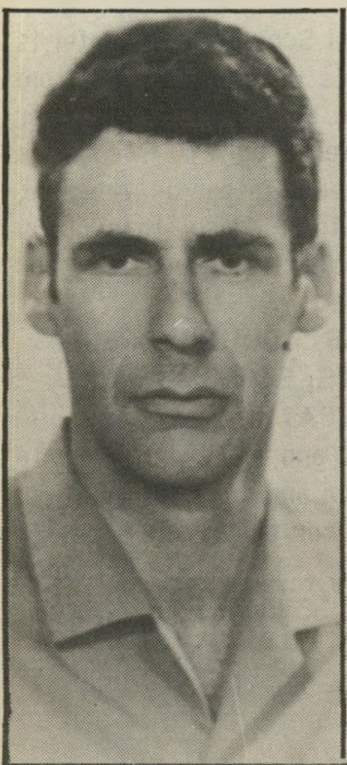
פרופסור רואי, לא טובה ביחסי-אנוש...