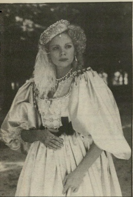
שחקנית קאתראל הבח הנוקס

ומגלה שהעולם שנשט לא קיים יותר, ואילו לעולם החדש אין הוא שייר. צילום מפלא, אווירה עצובה, וחיפוש מתמיד אחרי שורשים, באמנות ובמולדת.