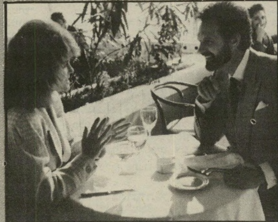
אלן אלדה ואן מארגרט: סבא הוא גם אבא

אבל בדהאם לא רצה לחזור על מירסם הצלחתו הקודמת, וכך נשאר רק עם פיטר סטיבנס בתפקיד מדען הודי, הדובר אנגלית במיכטא הודי מנחיק, ועם בימאי כבוד-תנועה בשם קנת ג'והנסון. ו'דהנסון, לא א בלבד שרצה להמשיך את חייו של ג'והני 5, אלא שגם אימץ לעצמו הצלחות אחרות, שכן יש בשרט דברים יותר מדי דומים לסרטים אחרים. אבל זה רק פרט שולי. העלייה קלשה. מדען שטאלץ לפרוש מעבודתו במיפעל הודי בוטיקה, מנסה למכור רובוט צעצוע קטן וחביב לעוברים ושבים ברחוב, עד שהמלכט עליו רוכל תאב-בצע ורמה-שכל ומשכנע