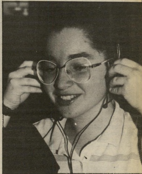
נבחנת גילה רוזמן, חסד ידעתי שאשתדל...

זהו אחוז גבוה. ברר-כלל עוברים רק 45 אחוזים. למי מהעוברים שיצטרף לאירגון צפויות חוויות מסעירות. לחברי מוסא בקליפורניה יש קבוצות-שיוט, ובניד יורק משקיעים חברי האירגון כבורסה, כחד, כקבוצה. במלויה הם קוראים ספרים ומטיילים בחיקהטבע. באנגליה עורכים פיקניקים ומארגנים חוגי-היסטוריה. הקבוצה הישראלית, כשתקום, תוכל לבחור לה את פעילויותיה בעצמה. הכל תלוי בכס, אומר וינסנט, וזה נחמד מאוד. היום יש מועדונים וקבר צות לכל רבר, לכל נושא. למה שלא יהיו גם קבוצות של חכמים?