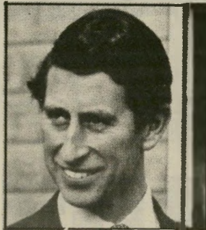
הנסיך ציארלס הקודם הוצא להורג

נחוג בבירמינגהאם , אנגליה, יום-הולדתו ה-40 של הנסיך ציארלס פיליפ ארתור ג'ורג'י , יורש-העצר הבריטי, במסיבה רבת-משתתפים שנערכה במוסך תת-קרקעי, בחסות אירגוני-הנוער המקומיים, שצ"רלס הוא פטרונם מאז מהומות העניים והשחורים, לפני שש שנים, בעיר, שהיא השנייה בגודלה בבריטניה (מיליון ו-100 אלף תושבים). יודעי