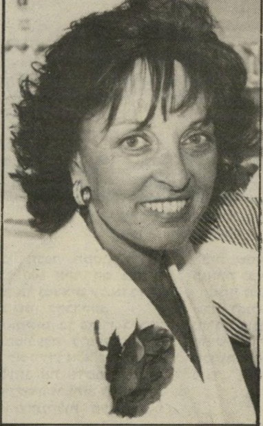
אדית תאומים חבר חדש

לגברת תאומים הזאת יש בן ובת בוגרים. לפני הרבה שנים היא התאלמנה מבעלה הראשון,