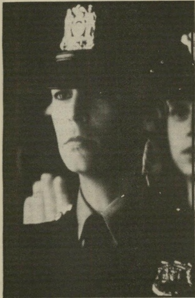
שחקנית קרטיס חנילים בהחברות

מעולם לא הכחישה כי שמם של הוריה פתח לה דלתות: "הייתי ילדה מלאכית אופיינית של כוכבי-הלכת של הוליווד, שמעולם לא היו בבית,