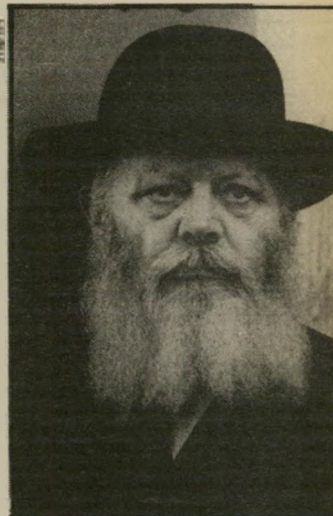
הרבי מלובאביץ מכירה פומבית

כאזרחים, הממלאים את חובתם למדינה על פי חוקי ונככלל זה החובה לשרת בצלה כאשר הרוב בישראל יחליט סוף-סוף להחיל עליהם חוק זה, מגיעות להם מלוא הזכויות המוכסחות לכל אזרחי-המדינה, בלי הכול אומה, רת, גזע, לשון, מין ועדה. אולם טירוף הוא לשתף אר-