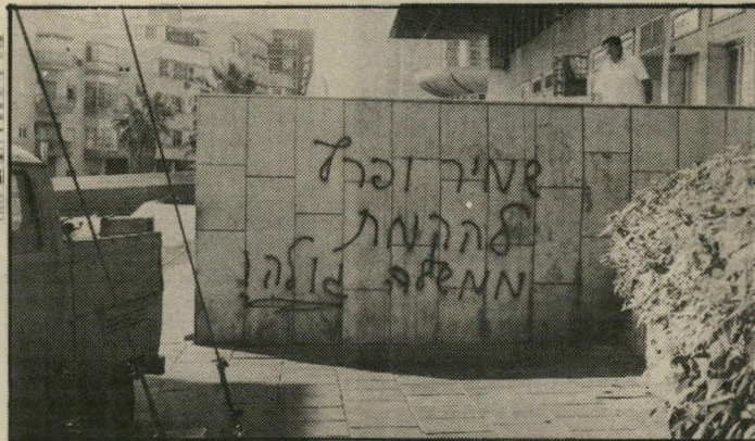
כתובת יקיר בניכרהאחרים בתליאביב מחשלהינולה

עברנו על המירגם במשך חודש ומסרנו אותו לטלוויזיה שבועיים אחרי ראש השנה. אחר-כך הודיעו לנו על שינוי הקלפיות ואז היינו צריכים לעבור על כל הקלפיות במדינה — 4,600