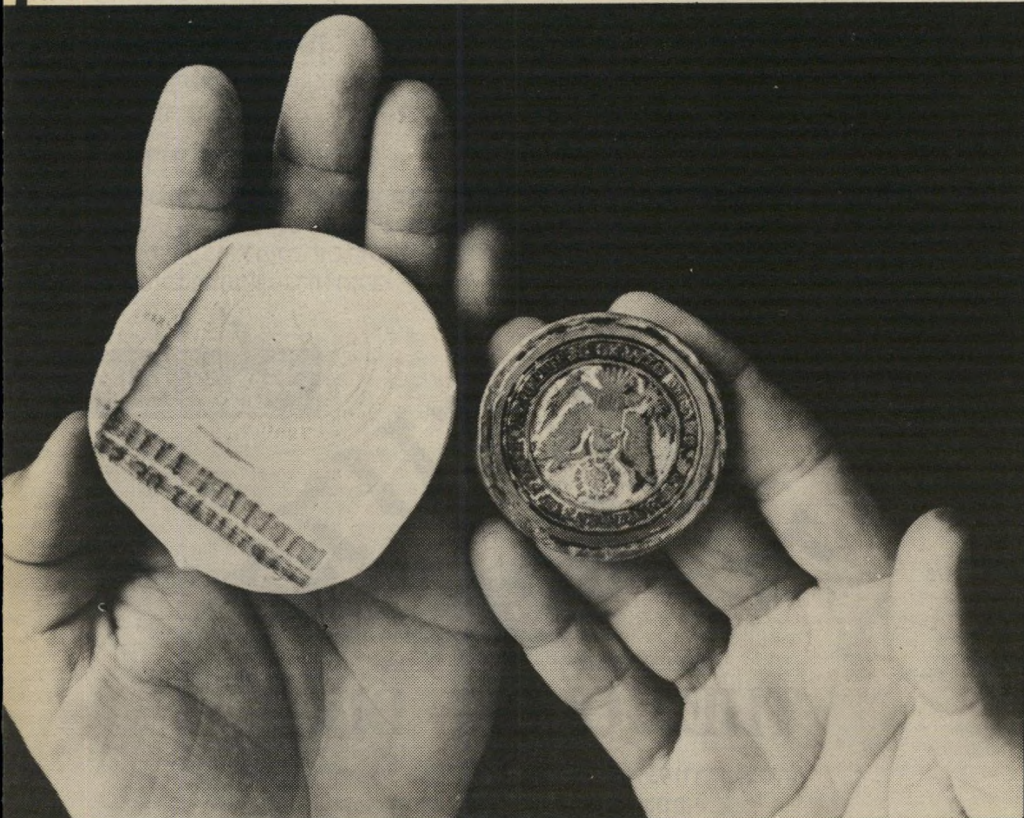
חותמת הטבעה אמריקאית מזוייפת ותבנית גבס הוא לא התרחק בסבון...