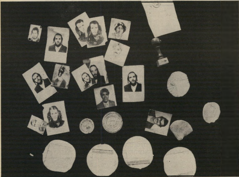
תוכן החבילה: תמונת אברכים, תבניות וחותמת הישיבה הוא לא הביס באשטון...