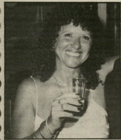
ציפי רום היא מוסד בחיפה

מסתבר שהגברת רום התוססת בילתה משהו כמו ירחיבש מוקדם עם אהובה וכרווגה לחיים,