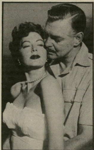
אווה גרדנר* חלום-ילדות של רבים

סיפר איש-עסקים ישראלי ש- שהה באחרונה בלונדון: הוזמנת למסיבה קטנה בשעת