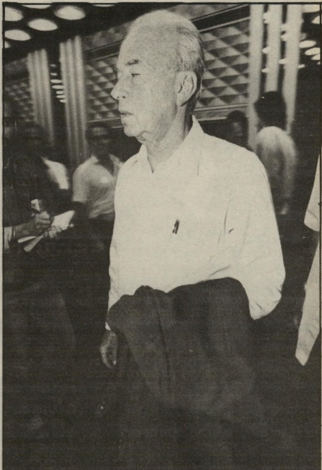
יצחק רבין הסיר את החליפה, שימעון פרס אוכל אשל