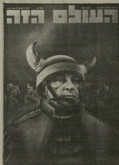
שרון תשמי"ב ויקונו פראי

הוא לא יצייר עוד אנשים-שנה. בשבוע שעבר, בגיל 63, נפטר לפתע פתאום. מנהל חברת-פיטוטום, שבה עבד לפני שנים, אמר עליו בפשטות: «איש נהדר». אין מה להוסיף על הגדרה זו.