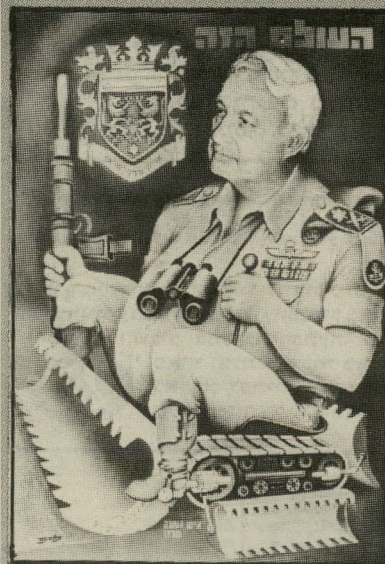
שרון תשמי"א דחפור כמו פוק

אני מניח שגם שימעון פרס בשכשכת-זוהו (תשמ"ה) ויצחק שמיד כרוכב על סוס-עץ בקרוסלה (תשמ"ו) לא התלהבו מציריהם. על ליף עצמו ידעתי אך מעט. ידעתי ששמו המקורי היה ליפנסקי, שהוא יליד העיר לייפציג בגרמניה, שעלה ארצה בגיל 8, מראשי הגרפיקאים בארץ, שעיצב בולים ומסמכות וזכה בפרס מטעם הא"ם. הוא היה אדם שקט מאוד, עדין מאוד. כשנים האחרונות החלים להקדיש את עצמו לציר.