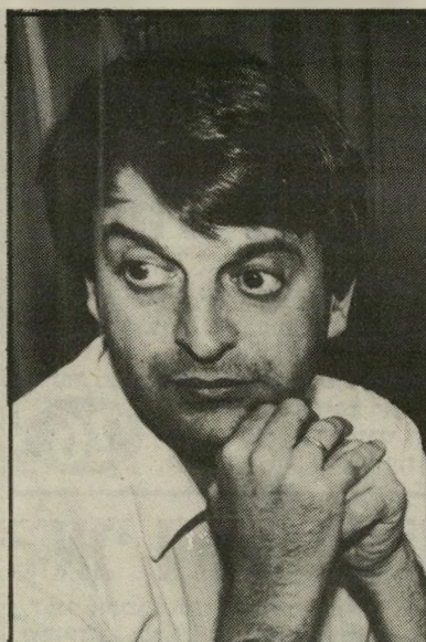
אישה-הסברה מרידור בלוריתו

דולה, המודיעה לנו, כי טרם הגיעה השעה להכין את בגדינו לחורף, הרי אין כל אפשרות לאכסן (כדבריה) את בגדיה-הקיץ. בגדים מאחסנים, לא מאכסנים.