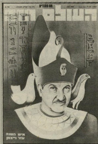
וייצמן: תשל"ח מוקונו מרי

מכיוון שכל השערים של אנשי-השנה מוכנים בסודיות רבה, פן יודלף סוד והותו של איש השנה בסרם עת, כמעט ולא הכירו את ליף גם במערכת. שיתוף-נוני נערכו תמיד בצורה דיסקרטית מאוד, לרוב בבית. אהבתי לעבוד עם ליף, מפני ששרה בינינו