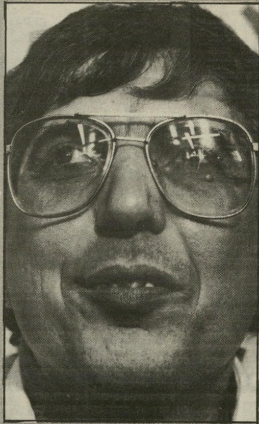
אהרון אבו-חצירא: "נראה שהעניין העדתי כבר לא כליכך חשוב!"