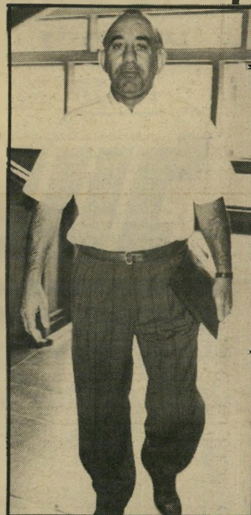
איש-עסקים קדם הסדר פירוק

לוריא היה בן למישפתח-מנופאים סלוניקאית. החברה פעלה בהצלחה