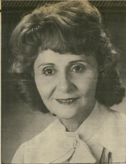
עזריכנגרדו רנה, אז והשבוע

הגבר חייב להבין שתפקיד האשה אינו מישינו"