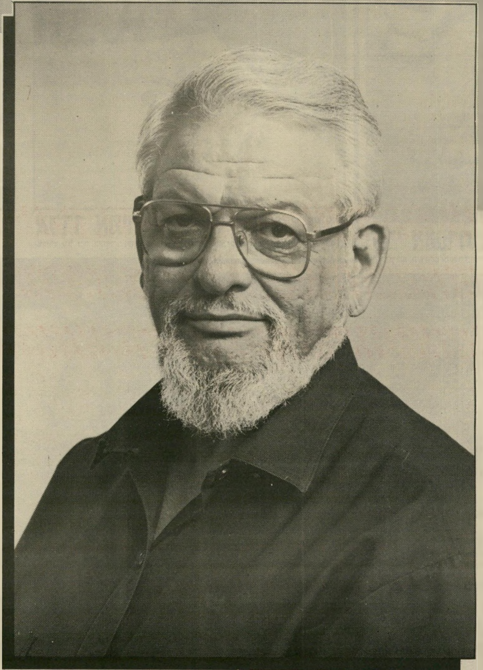
ח"כ יאיר צבן, ראש רשימת מפ"ם לכנסת