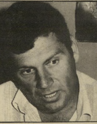
פירסומאי טמיר, מה אתה צועק?

כבר לא רציים. נקודה נוספת: הסקר של אינוד המפרסמים מתייחס לי כל המדינה. אבל הרי יש מקומות מרוחקים, שלא קולטים את קול השלום, וכך יצאו תוצאות מעוותות נגד אייבי. זה הכל. עניין של צורת-ניסוח השאלות. אם נעשה סינתזה בין הסקר