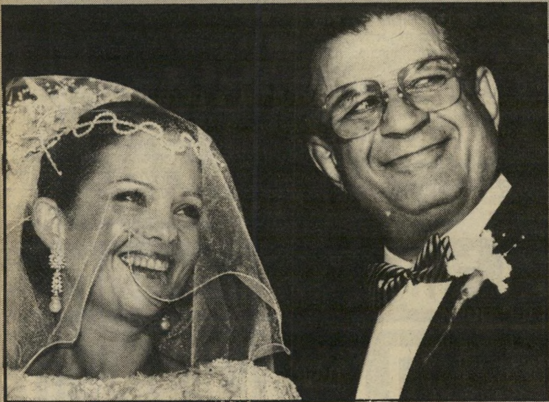
צילון צפירי, תערוכה חיה