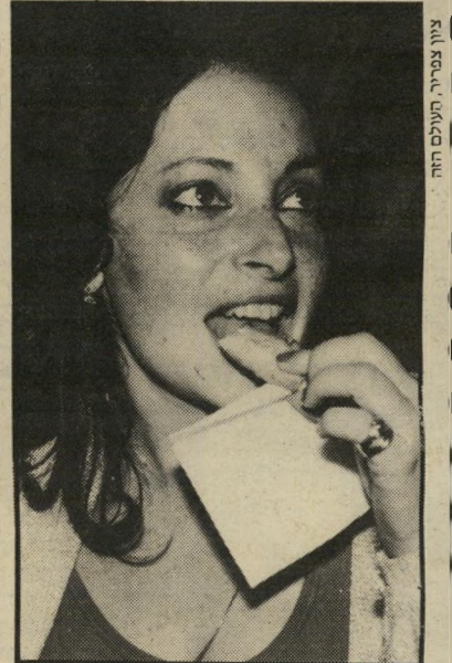
צילון צפירי, תערוכה חיה

ורד קולק חיה במשך כמה שנים בניו־יורק, שם