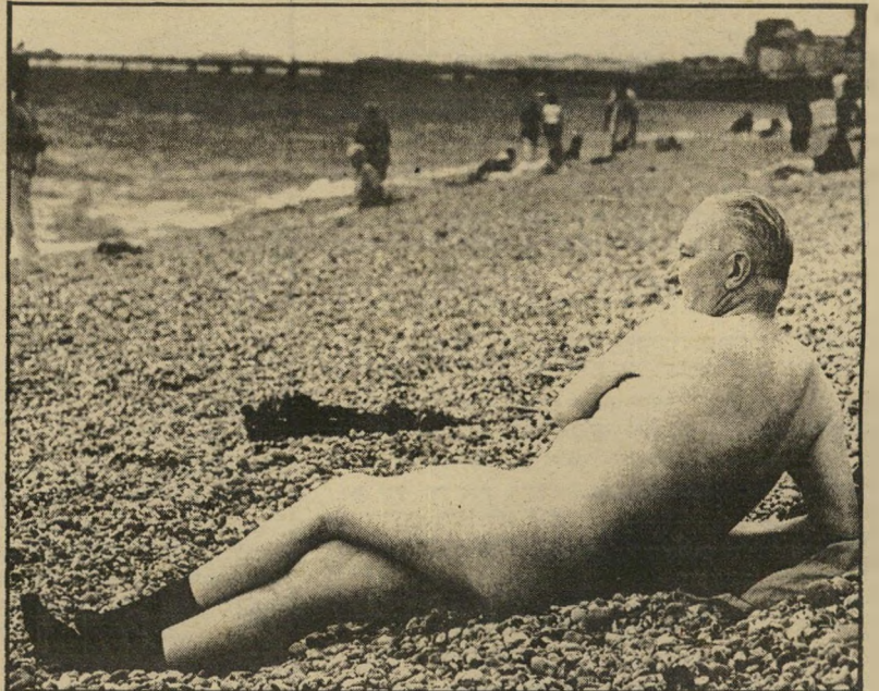
גופות לשיזוף: לבן מדי

השמש, כידוע, אינה מיטיבה עם האיים הבריטיים, אם להטיב פירושו להרבות בהופעות.