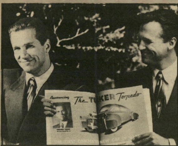
גף ברידגיס (משמאל): אולי טאקר ואולי קופולה

פרנסיס פורד קופולה, הרואה את עצמו כטאקר של תעשיית הקולנוע, מביע את מלוא אהדתו לגיבור שלו, המסמל בעיניו את