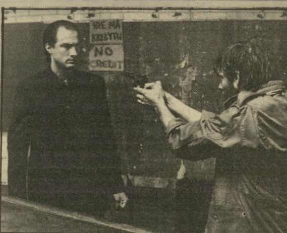
סטיבן סיגל (משמאל): עם המאפיה לעזרת החוק

המישרטה כן, אבל לא ניקו, שמפקיד את רעייתו הצעירה ואת ילדו הטרי בידי דוד מן המאפיה, ואחר-כך יוצא לחסל את כל המנוולים שמבריחים קוקאין מאמריקה הלאטנית. בדרך הוא מוצא פצצה בכנסיה, עוזר לוועדת-חקירה של הקונגרס,