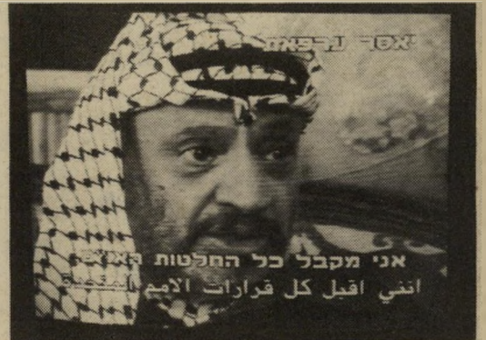
יאסר ערפאת: .אני מקבל את כל החלטות האו"ם, כולל 242 ו-338. אני מקבל את ההסכמה הבינלאומית.