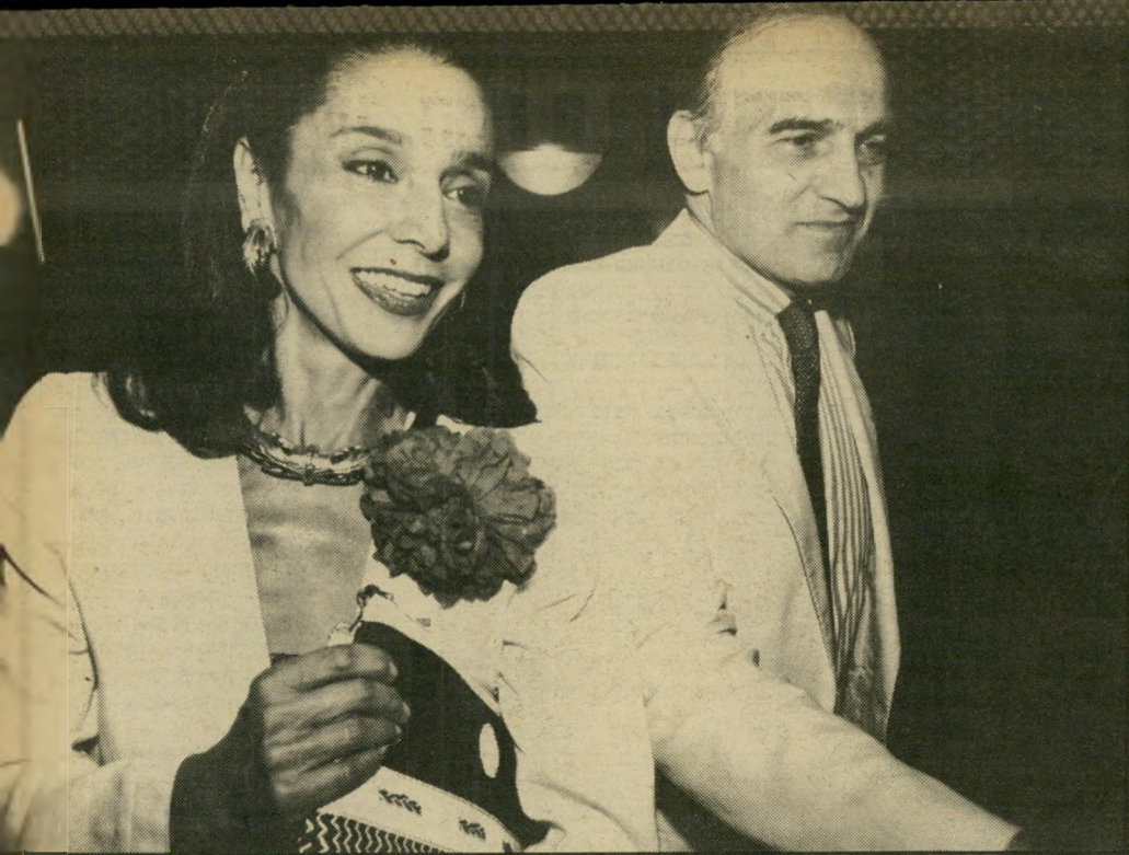
פרקליט פיזר (עם אשתו) יועצים לעניינים סובייטיים

רונרט ("באר") מקפרלן (או היועץ לביטחון לאומי של הנשיא רונלד רגן), ולא עם מוכיר-המדרינה ג'ורג' שולץ, כדי לטפל בענייני הגיש זה.