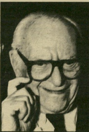
האמר מתווך עם לוב

הממשלה, והוא מציין שישראל מוכנה לחתום על הסכם סודי עם עיראק וארצות-הברית, בתנאי שתהנה מחלק מהנפט שיגיע לעקבה.