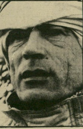
קדיאפי קשרים סמויים

ובמשך תקופה ארוכה טען שכרצונו להיות מלה. בימי מילחמת-העולם השנייה שירת בצבא הבריטי, ואחר-כך השתתף במילחמת-העצמאות של ישר-אל, בשורות ההגנה. למחרת ההכרזה על עצמאות המדינה העברית החליט להישאר בצבא, וגם להמשיך בלימודי-המישפטים. זמן לא-רוב לאחר שהועבר למישטרה הצבאית, הצטרף לביתי-הדין