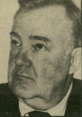
מיז אזורה לפרס