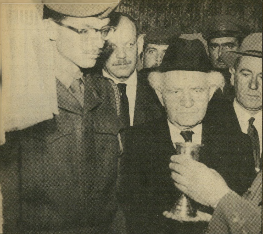
בן־גוריון (בחתונת נכדו יריב בן־אליעזר) לא היה עובר בטלוויזיה

בצד הימני, הבעייה מסוכנת יותר, כי שם כולם מסתערים על עוגה מוגבלת. אם יש התלבטות, זה אצל הליכוד והרתיים המתונים, המפר"ל. כל האחרים משוכנעים בתפיסה הרתית או הלאומית. יש מיבחר אדיר בין מיפלגות, שיש ביניהן הברליניזואנסים בלבד. ולכן יש חשש שכמה קולות יאברו לכל הגוש הזה, וזה חיזוק של גוש־השמאל. ואי־פרופו זה, אני לא נגד ביקורו של שימעון פרס אצל הבאבא סאלי. כל הזמן הצטייר המערך כמיפלגה שבזה ליוצאי ערות־המזרח ולמסורת. זה לא הופך את שימעון פרס למרוקאי או לחרד. אבל זה שובר את המיתוס כאילו פרס, הסוחב את המערך על הגב, הוא אנטי־מסורתי. זה הפשיר את הקרח בין פרס לבין רבים שטענו שהוא מזולזל במסורת.