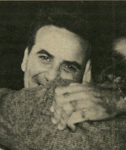
זוילי מצטלם ונהדר

● אתה בעד עימות בין ראשי שתי המיפלגות הגדוד לזו?