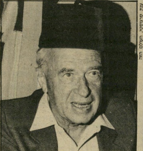
רבין מקרין יציבות