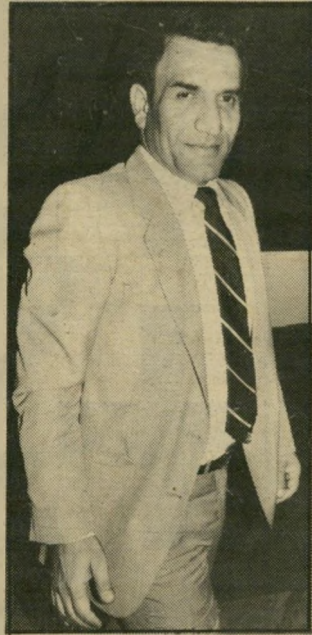
מנהל-פרש בינו וילנון הריבית דוחה הפסדים

צדיק בינו התחייב לנהל את בנק במשך ארבע שנים. הוא פורש אחרי שנתיים.