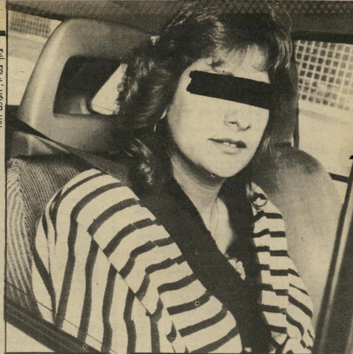
עובדת מ"י החזרה שלך גדול יוחר ויפה יוחר"

בעיקבות פירסום כתבת-חקיר כי 1985 על הנעשה במוסד, שאותו ניהל ניצן, פתחה ועודת-הביקורת של העי"