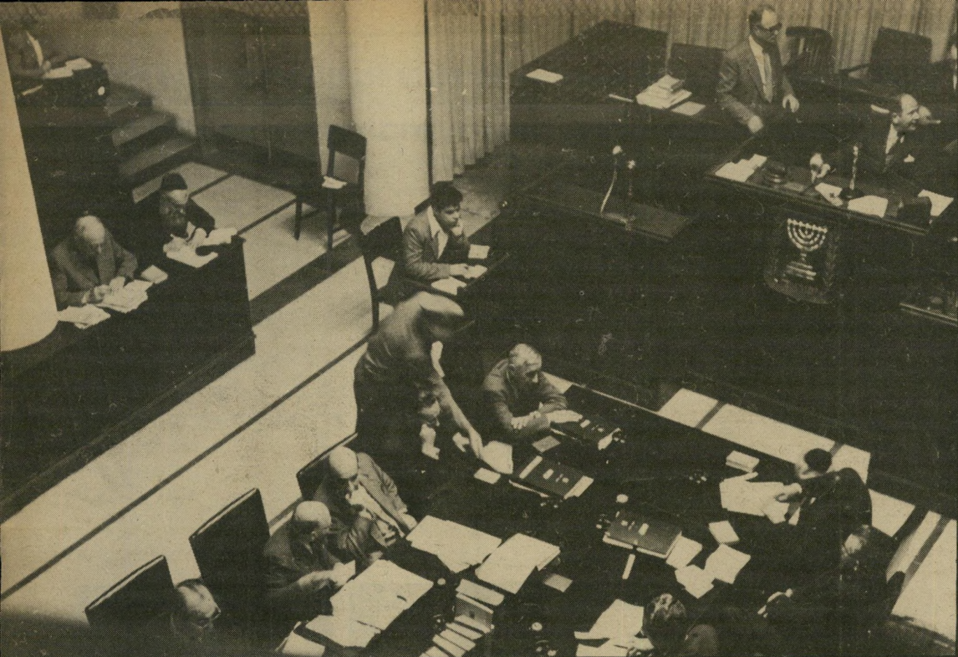
ארכיון העולם הזה

אורי חמישה חודשים שחורי דוויק מבית-החולים. הוועדה הפי