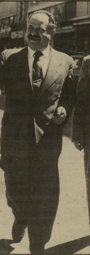
איכיון העולם הזה