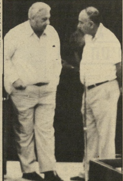
עם פרס על תקן המערך