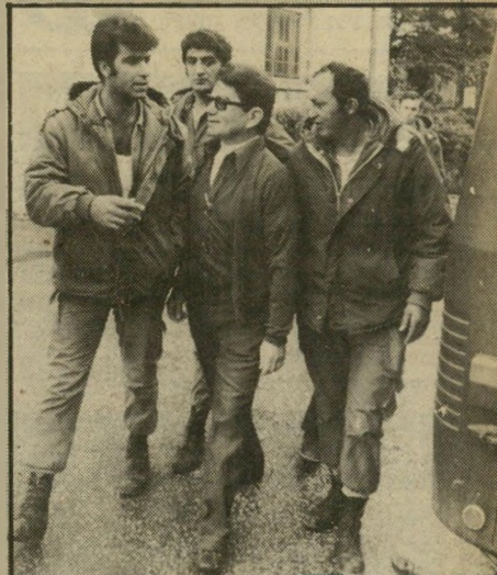
ידלין בדרך למעצר, שיא החופשה

המלון מאי-העסקים אמנון ברנס. ידלין קיבל, לפי המידע, שחד בסך 50 אלף דולר עבור עיסקה זו.