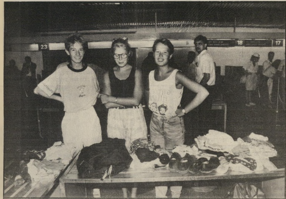
מעמד מביך כד נראית המיזוודה מ"בפנים, לאחר חצי שעה של בדיקה ביטחונית. התיירים הזרים נבדקים בדיקה ביטחונית מדוקדקת. התיירת הבלגית לבשה גופיה שחורה מעל למיכנסי ברמודה משובצות. לידה חברו-תיה, שבאו ללוותה ולתת לה תמיכה נפשית.