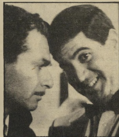
שחקנים יוצפן ובריאבא הרבה חחונות

עם זאת, ארכעת סירטי השנה, כך נרמז, מיצו בדרך הטובה ביותר את השילוב של התוכן והצורה, כל אחד בדרכו. כך למשל, הסרט המרהיב ביותר של השנה, מעל ומעבר לכל ספק, הסרט שפרש את היריעה הרחבה ביותר והצלילי להכניס בה לא רק ציבועיות אלא גם משמעות, היה הקיסר האחרון של ברנארדו ברטולוצ'י, הצצה ממשית ראשונה של עיניים מערביות לתוך ההיסטוריה של העם הגדול בתבל, ושל קפיצת הדרך האיריה שהוא עשה, משילטון אבסולוטי