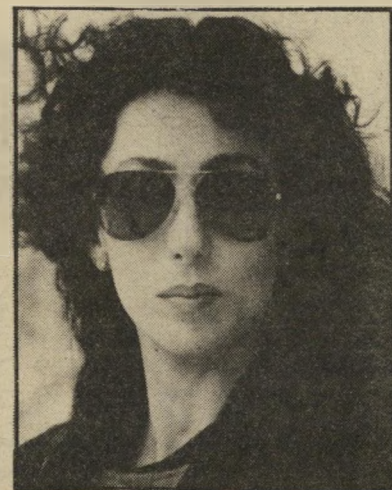
שחקנית שר לא זקוקה לשיעורים

הצלחות מיסחריות או לפחות סרטים שלא ביישו את מייבאיהם. הקהל הישראלי הוא, כנראה, פחות אטום ומוגבל מכפי שנהגו להאמין. רשימת הסרטים הטובים כוללת כמה סרטים הוליוודיים יוצאי-דופן, שהוליווד אמנם מפצה אבל לא צילמה, ואם צילמה, לא היא חוקיה השגורים. כך למשל חוכמת רחוב, סרט תעורי בלתי-רגיל שצולם ב-1984 ברוכות סיאטל, על חיי נוער מופקר בגיל העשרה. סוכת ירח, הקומדיה המלבבת ביותר של השנה, הוא קרפרודוקציה קבדית, ואילו הנוטיבה הקטסוה הוא אוסף של אגדות משוברות יחד בראי עקום, כשרביטו של מי שמבטיח להיות אחד הבימאים המובילים בהוליווד, הלא הוא רוב ריינר הידוע גם כ"ראש כרוב" מן הסידרה הכל נשאר במישפחה.