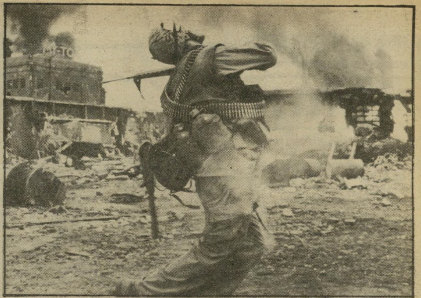
1. מטאל ג'אקט (ארצות-הברית)