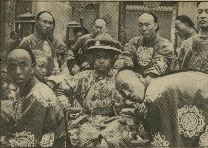
2. הקיסר האחרון (בריטיה-איטליה)