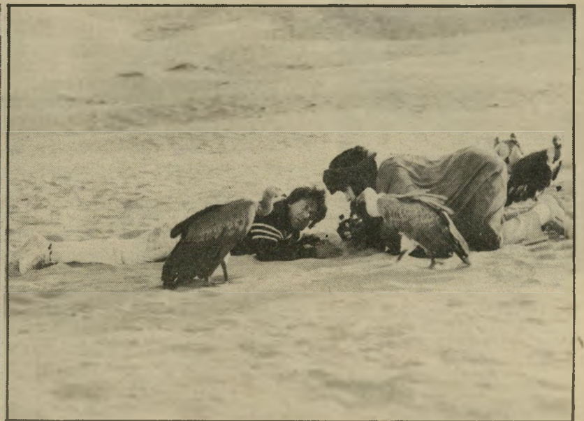
1 אישתר (ארצות-הברית)