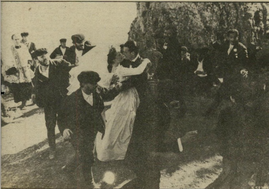
2. הסיציליאני (ארצות-הברית)