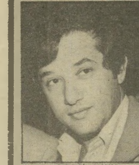
מישפחה ליפקה התנפחה