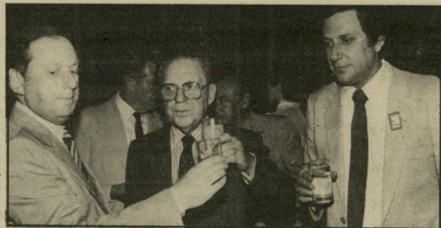
צויה נעשה העולם הזה

סך הרווח הגולמי המאוחד הוא 7.5 מיליון שקל. ההוצאות הכלליות הצי פויות הן 5.5 מיליון שקל, והרווח לפני-מס הוא 2 מיליון שקל. להכנסות יש להוסיף אלמנט חשוב נוסף. הרומנים נותנים אשכנזים-ספקים של 180 יום, ללא ריבית, הניתן לניצול כהון חוזר תמורת ביטחונות. מכיוון שלא נחוצו אשכנזים-ספקים לתקופה כה ארוכה, ניתן להשתמש בכסף להכנסות גדולות. הכנסה נוספת היא מהתחייבות הרומנים לרכישת-גומלין של מוצרים דנחא.