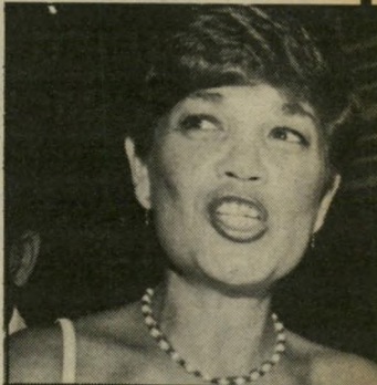
צויה נעשה העולם הזה

בחברת א.צ. ברנוביץ' מחברת הבנייה והנהגים החזקות בארץ, צפויה מילחמה בין צאצאי מייסד החברה.