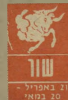
טור 21 באפריל - 20 במאי

קשר שהחל קמט בימים אלה יעמוד למיבחן ב-15 וב-16 בחודש. אחד מביניהם פונה לפתע לכיוון לא-צפוי ויביא לקור"פליקס. חוסר-נכונות לה"ש פשר עלול להביא לניתוק. ב-18 וה-19 סוחפים אתכם למסע בזיכונים מצבכם הכספי אמנם השתפר ואף צפוי שיוגיע לירכם סכום כסף שחיכיתם לו זמן רב, אולם כדאי לחסוך. תחו"זוקים לו. אם לא למע"קודם בקאריירה. ידיעה משפחת ב-22 או ב-23 בקשר לקידום בעבודה.