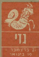
ג'מני 21 בינואר - 20 בפברואר

נסיעות שתכננתם עלולות להידחות או להתבטל. אל תצטערו. נכשיו זה לא הזמן המתאים. אנשים יקריים לכם עומדים לצאת לנסיעה ולהיפרד סכם לזמן קצר. אתם סרבים ליצור קשרים עם ארצות רחוקות. לחוסר יסורים חדש עולה על הפרק, אך בינתיים מוקדם להתחיל במקום שבו אתם עובדים סעמיים אתכם במיבחן סחר. היו זהירים העשוע. אל תבואו בדרישות וב תביעות. ב-18 וב-19 אתם עלולים לא להרגיש טוב, אך זה יחלוף. בבית יש יותר מדי מחיחות.