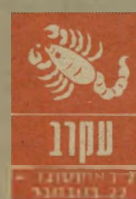
עקרב 22 באוקטובר - 21 בנובמבר

החמישי והשני יהיו די סוערים. אתם עובדים קשה ומקבלים תמורה נמוכה יחסית. חשוב שתדעו לעמוד על זכויותיכם. יש לכם הוצאות רבות ונראה כאילו אתם מתמרספים כספית, אולם אין זה כך. השבוע יגיע סכום כסף מסקול לא צפוי ויע"זור לכם להתחבר על הק"ש. שיים ה-19 וה-20 הם ימים מוערים לביצוע שגיאות מהבחינה הכספית. בקרוב מצפה לכם עבודה חדשה, יוקרתית ומעניינת יותר, אך גם אם הובטחה כבר, עדיין צפויים עיכובים ומיכשולים בקבלתה.