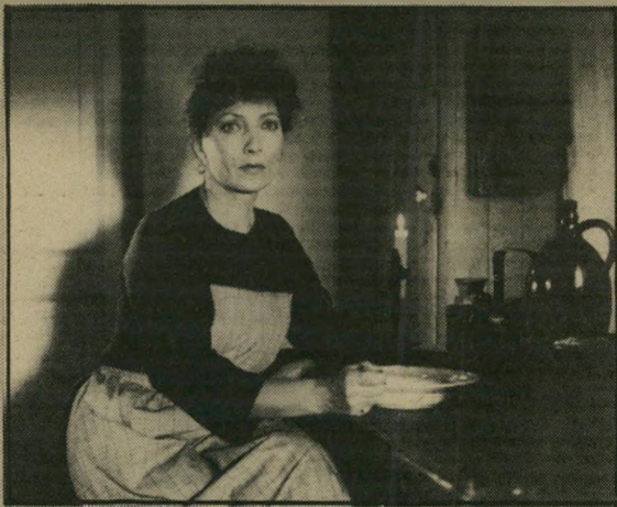
סטפאן אודרן - ההפתעה של השנה

ארוחת-ערב צרפתית מסורתית ביום הזיכרון לאביהן. הארוחה הממלאה את חצי הסרט היא פסגתו. מעין עבודת-קודש של האמן, הכרת-התודה העמוקה ביותר שבאבט יכולה להציע, וכמובן שבה היא משקיעה בלי היסוס את כל הכסף שהרוויחה. לשאלה מדוע עשתה זאת, הרי היא ענייה שוב, ישנה לסרט רק תשובה אחת: האמן לעולם אינו עני. האווירה, המישקה, הצילום - הכל מצביע על החלטתו של הבימאי גבריאל אכסל להישאר נאמן ככל האפשר למילה הכתובה. חגיגה קולנועית של ממש!