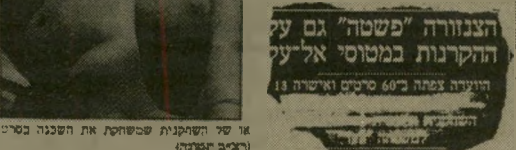
ישראלית חיה עד מתי ולמה?

אגב - חב"י הועדה גילו נחישות רבה הציבו לבעל בית הקולנוע לראות במקום זה את הסרטים של שחקני הסינמה (ריצ'יב סטנדר) כסופר החוה והשחקן של השחקנית הרצפית.