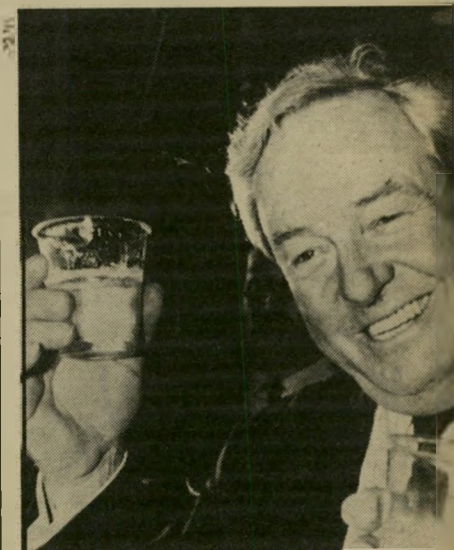
להיפן או להימא"ן?

בהתייצבות לימינם של עמיתיהם הנדרפים אין דם של סופרי מעריב רב להם, כפי שראינו. אבל ככל השייך להפרכת השמצות וכזבים כאמת צריך להשתדל כדי למצוא להם מתחריים. וכך, כרשימה שכל כוונתה הולכת שולל, נתפס מיועדנו הכראי חנוך כרטוב לגילויי-דעת