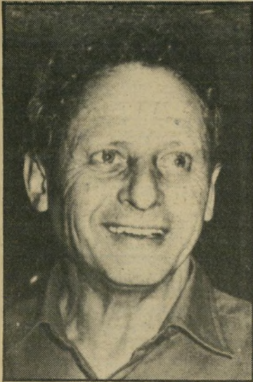
אסור לי לפעול - מגד

אחרון מגד בתגובה על דבריו של יורם קניוק שפא"ן שימש בעבר כמישרד נסיעות בשיטת שמור לי ואשמור לך: "אינני יודע מדוע צריך עכשיו לעורר מחדש את כל העניין. התפטרתי מפא"ן לפני שנה ואין לי עוד קשר למה שקורה שם. אבל קניוק היה חבר פא"ן וגם בתקופה שעמדת בראשו, ולא שמעתי מפיו אפילו מילת ביקורת אחת. הוא אמנם לא נסע, אבל לא מחה על נסיעות של חברים אחרים. מה פתאום הוא נזכר לצעוק עכשיו? גם לא נכון להגיד ששלחנו רק זה את זה. פנינו למשל לאנטון שמאס ולודו גרוסמן שייסעו לקונגרסים של פא"ן. בסוף הם לא נסעו."