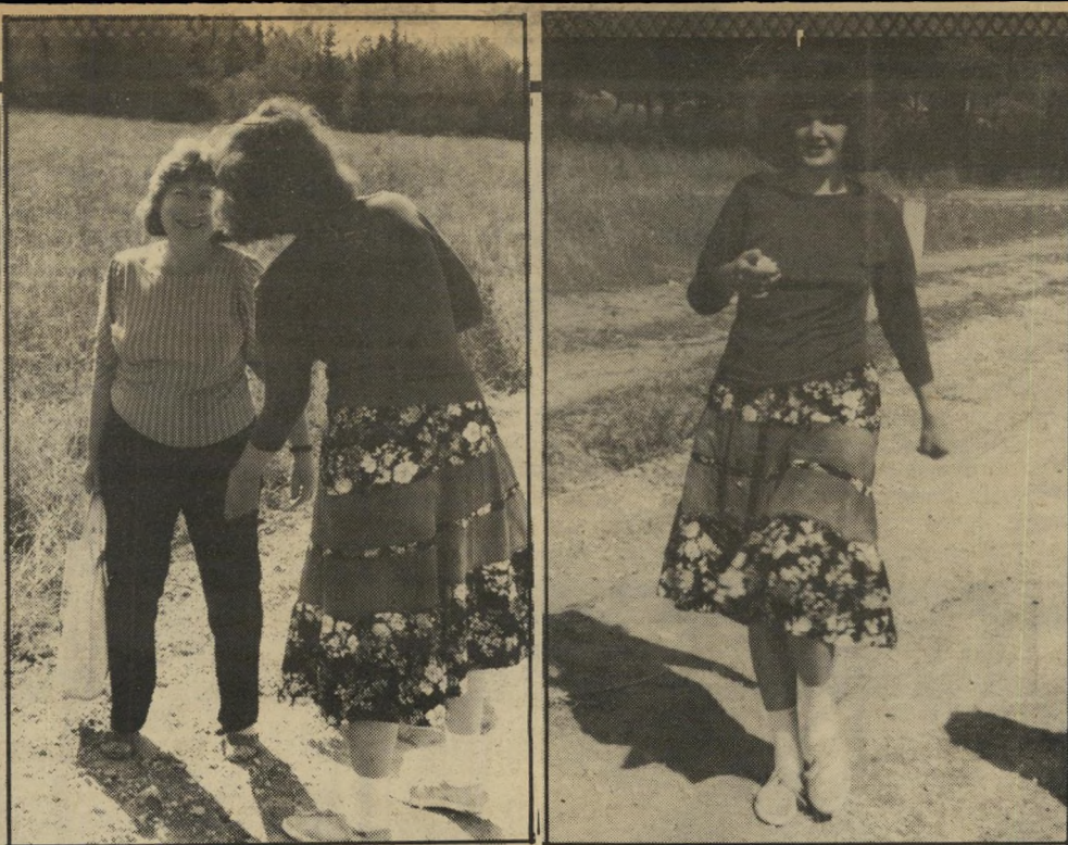
הבת רסנה, לברה ועם אמה

● אבל אם ישראל היתה נסוגה מהשטחים ב-1967, לא היתה קמה מדינה פלסטינית. שלא קרה, כי המילה אם לא מתייחסת למציאות.