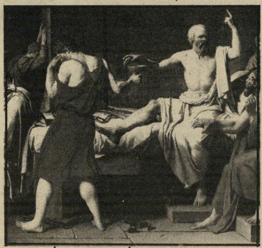
סוקראטס מקבל את כוס-הרעל

יצאתי לשטח. קלקיליה היתה עיר-רפאים. אחת השכונות היתה הרוסה-למחצה. נראה כי הופעלו בה רחפורים ומיטעני-יחבלה. בדרך מקלקיליה לשכם פגשתי בפליטים רבים — ביניהם זקנים