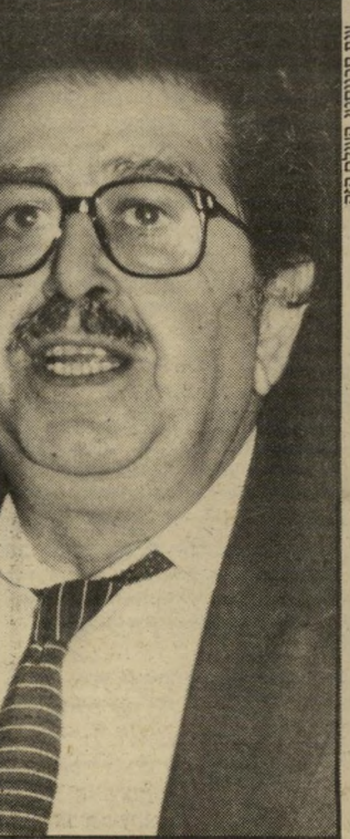
אל-חנסן, אני לא שונא אף אחד

הובילו אותם לא נכון. כשאדם לובש מדים אסור לו לחשוב, כך מחנכים את החיילים.