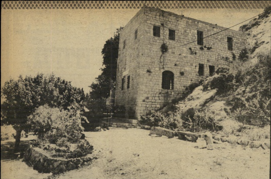
מערת אליהו בחיפה: בית מישפחת אל-חנסן אבא שלי קבור ליד הבית