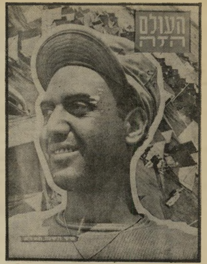
איש השנה תשנ"א העולה החדש האלמוני