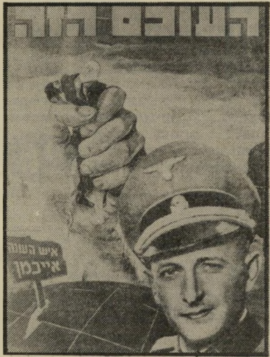
איש השנה תשנ"ד רכד-שואה אייכמן