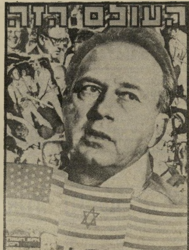
איש השנה תשל"ה ראש-ממשלה רבין