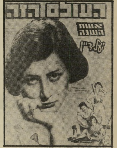
אשת השנה תשנ"ט סופרת דיין

האם יהיה אישה-השנה תשמ"ח גבר או אשה, ישראלי או זר, אורח או חייל, פוליטיקאי או אחר?