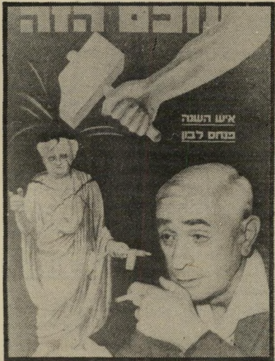
איש השנה תשנ"א מודח לבון