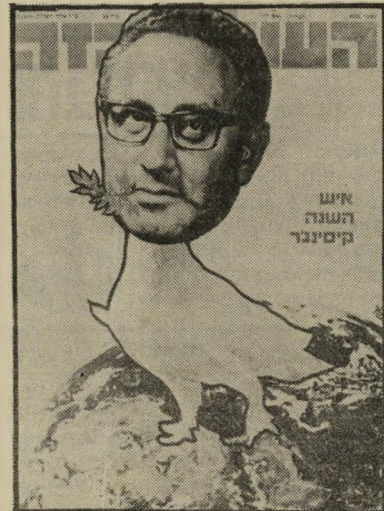
איש השנה תשל"ד מסדרי-ביניים קסינגר