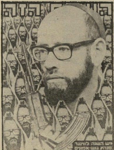
איש השנה תשל"ז מנהיג, גוש אמונים לוינגר