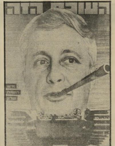
איש השנה תשל"ג מקיס-ליכוד שרון