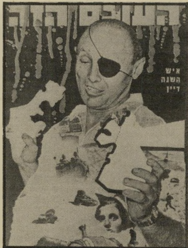
איש השנה תשנ"ז שר-ביטחון דיין