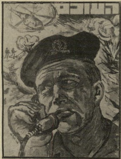
איש השנה תשנ"ח לוחם-בפידאיון רנב